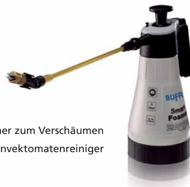
BÜFA Smart Foamer zum Verschäumen von Tolo KSR-Konvektomatenreiniger